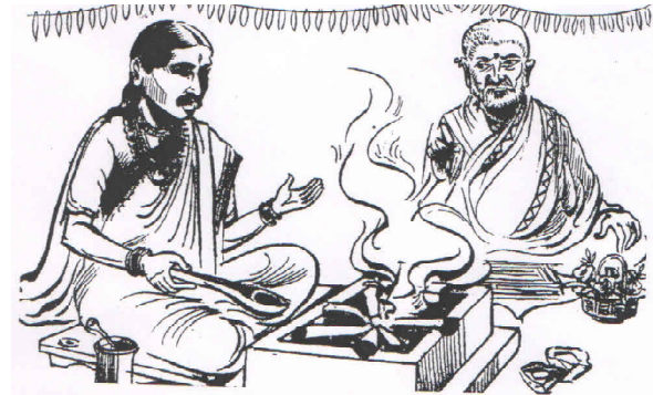
काल्यायनी व्रतार्था प्रारंभः - मासार्तां मार्गशीर्षीहम् अशा पुण्यपावन महिन्यात पयोष्णीचे संदर बाळवंतान पत्रारेच्या